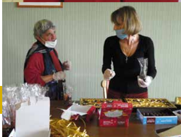
Préparation des colis de Noël