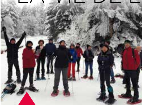
Sortie raquette - 9 janvier 2021