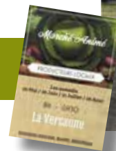
Marché du 29 mai 2021