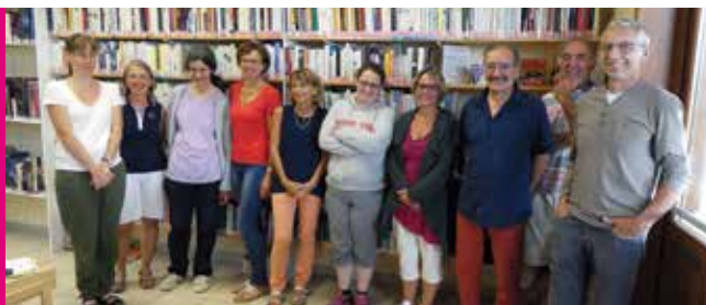
De gauche à droite :

Le réseau a maintenant terminé sa phase de mise en place et espère pouvoir développer d'autres actions et notamment culturelles en direction de différents publics de la communauté de communes.